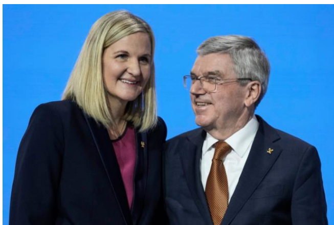
Kirsty Coventry con Thomas Bach.

Kirsty Coventry è un'ex nuotatrice, quarantunenne, dirigente sportiva e politica zimbawese, dal 2019 Ministra della gioventù, dello sport e dell'arte e del tempo libero del proprio Paese.