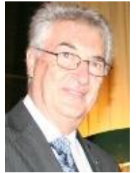
di Maurizio Monego

Mi è stato segnalato che sul numero di Disnar Sport di febbraio è apparso un appassionato articolo di Salvatore che analizza pregi e difetti della Fondazione P.I. - Domenico Chiesa. So che Salvatore è mosso dalle più lodevoli intenzioni. La sua è un'utile provocazione per riflettere su cosa fare per migliorare la conoscenza della Fondazione e suggerire azioni da intraprendere per ottenerla.