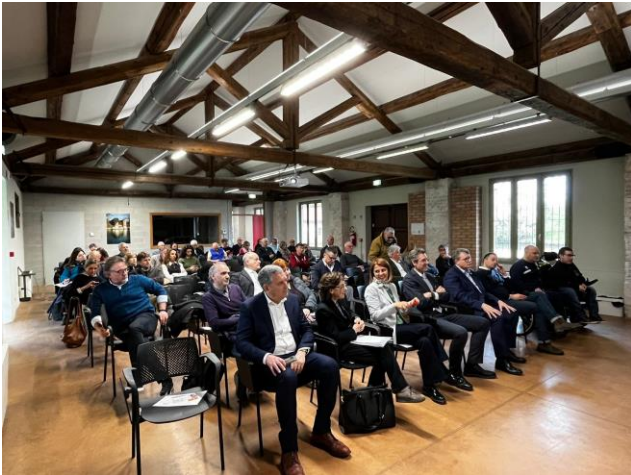
partecipanti al Seminario sul Safeguarding, nella Sala Convegni di Forte Marghera

Lo scorso 14 marzo il primo evento ufficiale dopo l'accordo di partenariato con Polisportiva Terraglio e Fondazione Efesto, grande successo a Forte Marghera per un seminario che ha lasciato tracce importanti.