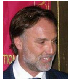
di Cesare Bozzetti

La sala era calorosamente partecipata, e la presenza dei soci del Panathlon ha reso l'atmosfera ancora più speciale.